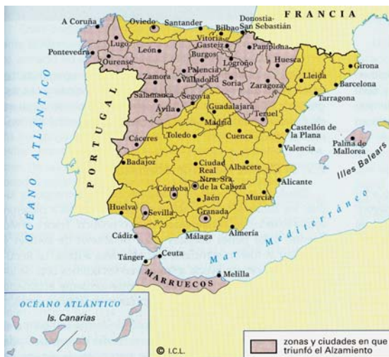
División de España tras el alzamiento militar de julio de 1936.